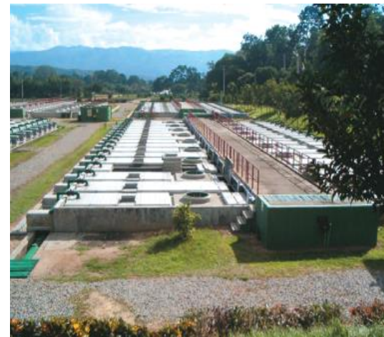
Foto: Planta de Tratamiento de Aguas Residuales Río Frio, Bucaramanga, 2007. Adriana Pedraza.

El potencial energético del metano que se captura en los STAR es considerado como insumo energético para la calculadora en el vector de bioenergía.