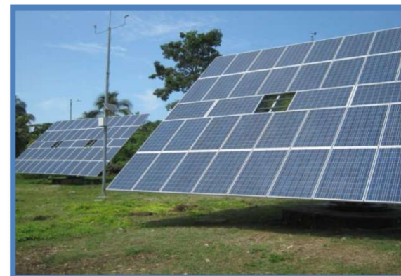
Foto: Seguidor Solar – Isla Fuerte, Bolívar http://www.minminas.gov.co/minminas/downloads/archivosEvento/s/9988.pdf

Para este caso la oferta de energía siempre es igual a la demanda y la generación no hace parte del balance general de la calculadora