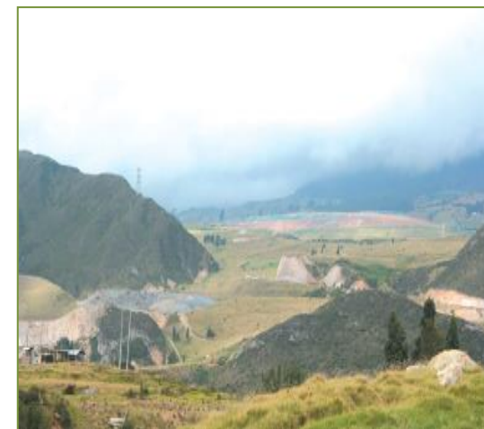
Foto: . Relleno Sanitario Doña Juana, Bogotá, 2009. Mauricio Cabrera L.

El potencial energético del biogás que se captura en los rellenos sanitarios es considerado como insumo energético para la calculadora en el vector de bioenergía.