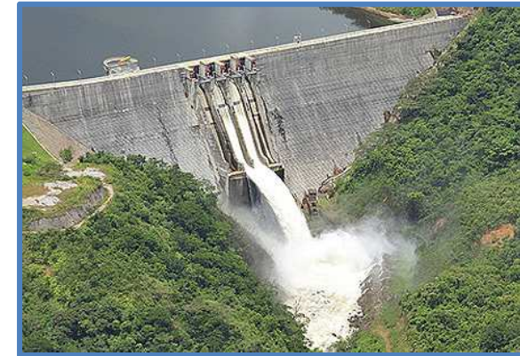
Foto: Hidroeléctrica Porce, Antioquia.

Se considera aprovechar el 70% del potencial hídrico del país al año 2050 llegando a una capacidad instalada de 21.720 MW. Esta potencia generará 102 TWh en el año 2050.